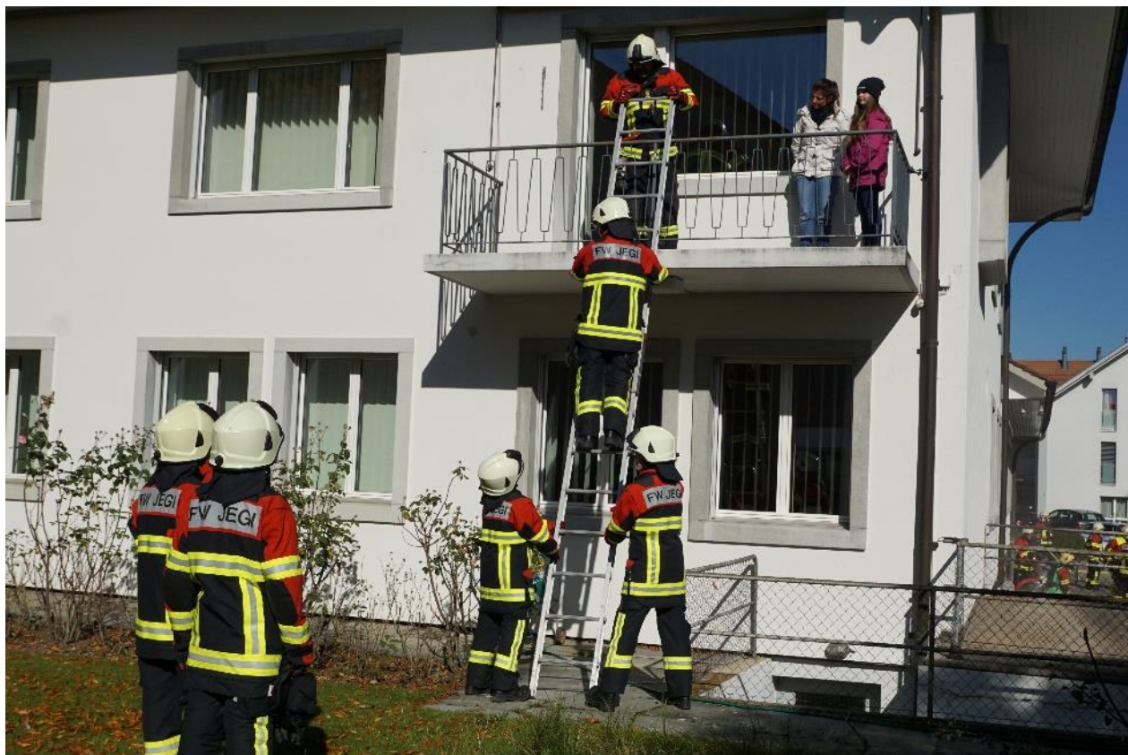
Rettung via Handschiebeleiter ab Balkon – beim Besteigen gemäss Reglement personell gesichert am Leiterfuss und –kopf.