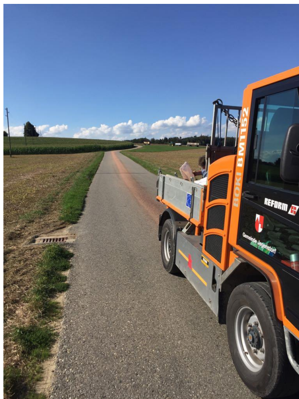
05.09.2018 Ölspur Zuzwil-Bangerten; Die Zusammenarbeit Werkhof-Feuerwehr funktioniert tadellos.