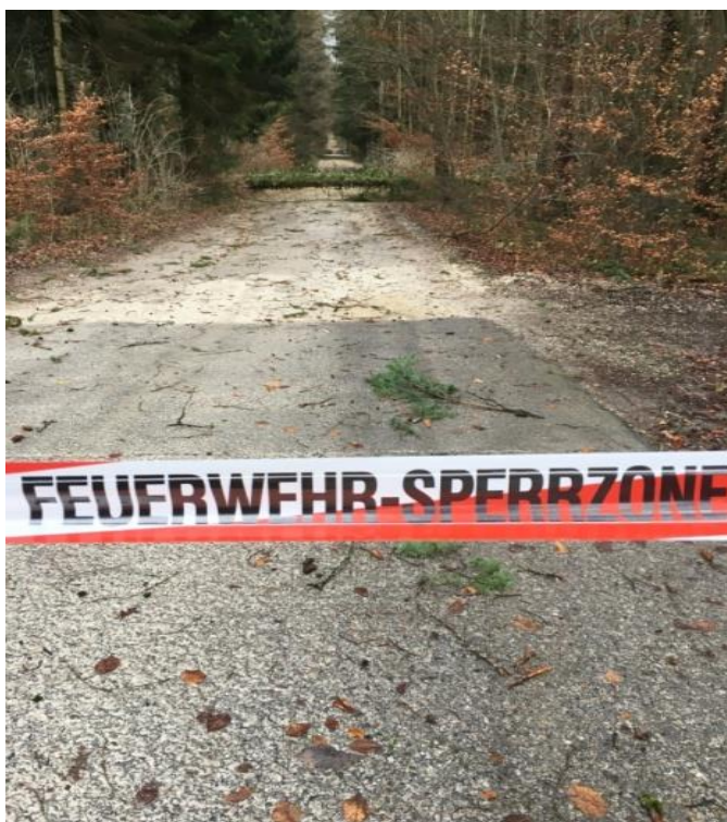
Der Sturm Burglind hat auch bei uns Spuren hinterlassen

Total: 46 Einsätze nach Alarmierung mit 506 Einsatzstunden