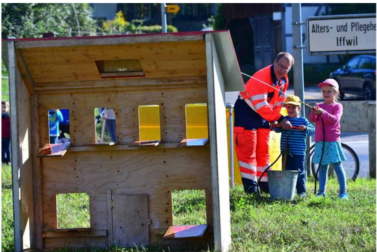
08.09.2018 Iffwilermärit – „Früh übt sich ....“ und dies unter fachkundiger Anweisung