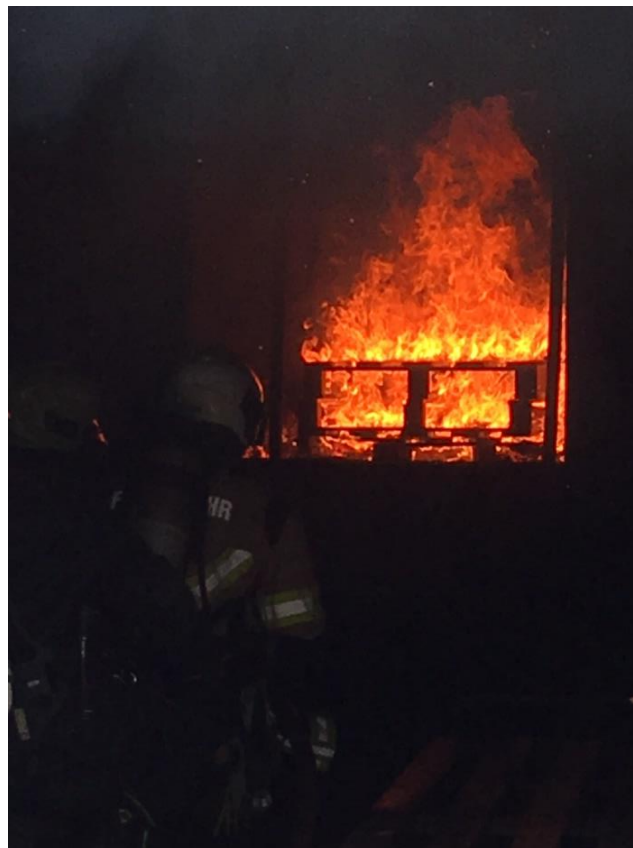
Basisausbildung: das Verhalten des Feuers wird zuerst anhand eines Modelles vorgezeigt und sodann eins zu eins "erlebt"