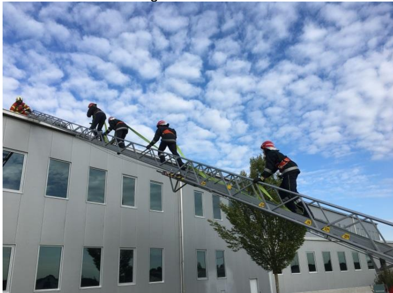
Die kleinen Wolken konnten dem Engagement nichts anhaben.