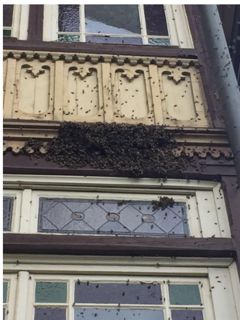
Auch bei Insekten ist die Feuerwehr zur Stelle.

(BMA= Brandmeldeanlage; VU=Verkehrsunfall; EFH=Einfamilienhaus; KU=Kollektivunterkunft)