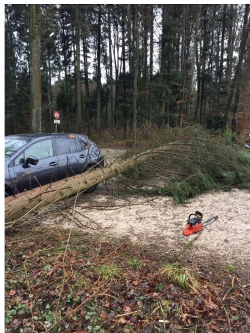
Dieser PW hatte Glück im Unglück.