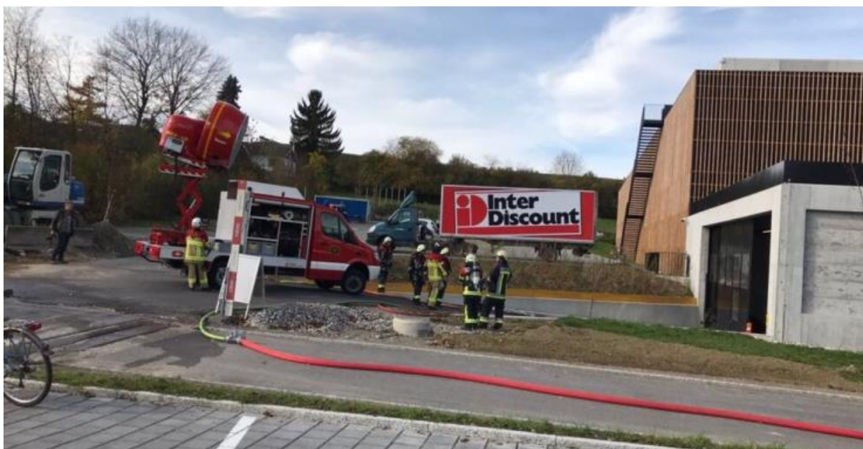
Die 2. Gesamtübung fand im neuerbauten Logistikcenter ID statt. Die Berufsfeuerwehr Bern war mit dem mobilen Grossventilator vor Ort. Über diese Übung wurde ausführlich im Blatt D'REGION vom 31.10.2017 und im Jegenstorfer 4/2017 berichtet.