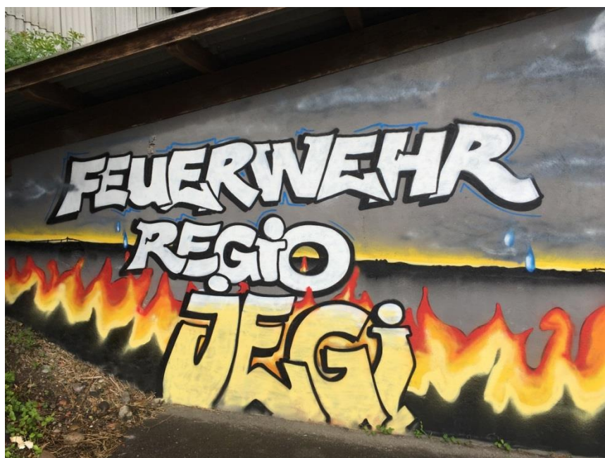
Herzlichen Dank der Jugendarbeit Jegenstorf für das tolle Graffiti an der bis dahin trostlosen Wand des Aussenmagazins in der Grube.